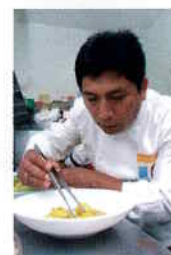
Cebiche Amazónico (1) – Astrid y Gastón, La Mar

La carne del lomo del paiche se trabaja en el corte tradicional del cebiche, pero marinado y sazonado con los ingredientes de nuestro generoso oriente: cocona en lugar de limón, ají charapita, sachá culantro, cebollita china. La preparación se dispone en hojas de bijao y se lleva a la parrilla, donde las brasas, por un breve pero significativo momento, harán lo suyo, dándole ese toque ahumado tan apreciado en una tradicional patarashca.